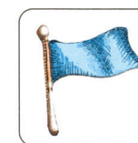
potrzeba pomocy medycznej